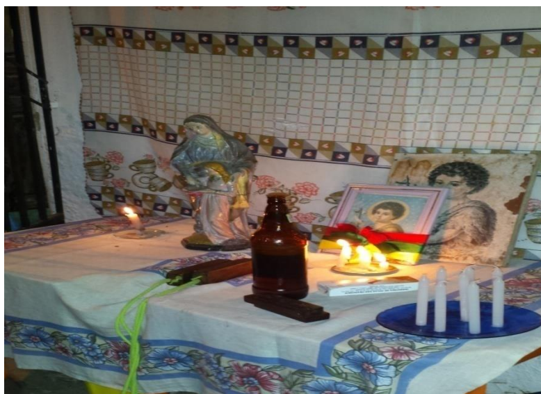
Figura 2 - Altar da residência de seu Mauro Dias.

A promessa feita para a Santa consistia que caso Ilton dos Santos se curasse de uma doença da qual estava acometido no joelho, o seu Pai Mauro Dias faria uma ladainha com a presença de um grupo de Bumba Boi na porta de sua casa, e assim foi paga a promessa após a graça alcançada.