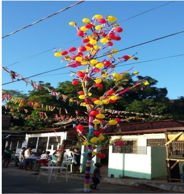
Figura 4 – O mourão

O mourão está preparado para que o Boi seja laçado e morto e alimmente simbolicamente os participantes da brincadeira.