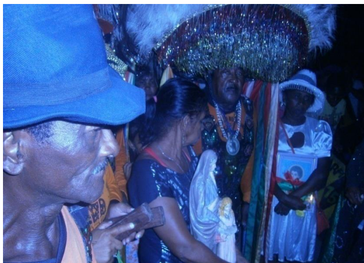
Figura 3 – Patrão do Boi, D. Maria e uma senhora com a imagem de Sant'Ana

Na parte de dentro da casa, na sala, já havia outro número de brincantes que esperam a chegada destes. Entretanto, fora aí que uma cena nos chamou a atenção. A partir do momento em que o Amo do Boi cantava toadas, uma menina vestida de índia, de dentro da casa, começou a entrar em transe. Procuramos saber dentre os brincantes sobre o que se travava e fomos informados que ela estava com alguma entidade da Mata e que seria ela a encarregada de levar o Boi durante o cortejo até a casa do senhor Mauro Dias.